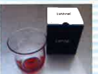
スキャンジナビアモダンアート。 DANSKタンブラー .....各日3名様