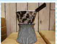
チーズでもおいしい! パラチョコレートフォンデュ .....各日1名様

※各日ともにハズレの方には「BOXティッシュ」をご用意しています。※賞品は変更になる場合があります。※スタンプラリー用紙は期間中、1家族1枚限り。※モデルハウスのスタンプは1社につき1つです。※写真・イラストは全てイメージです。※お子様のみのご参加はご遠慮願います。