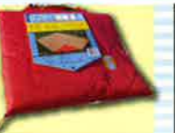
多目的に使える全天候型。 レジャーマット .....各日1名様