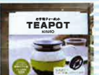
色々な茶葉で、ティータイム。 お手軽ティーポット .....19・20日各1名様