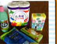
生活必需品がうれしい。 お掃除セット .....各日1名様