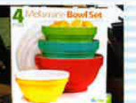
割れにくいカラフルボール。 メラミンボールセット .....各日1名様