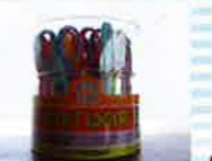
切り口がユニークな形に! クラフトばさみ .....18・20日各1名様