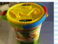
海へ砂場へGO!! Bucket Playset .....各日1名様