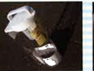
たて置き・よこ置き可能! 無印良品 冷水筒 .....18・19日各1名様