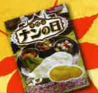
レンジでつくるナン 各日1名様