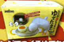
レンジでつくるゆでたまご 各日1名様