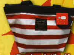
ミニトートバッグ 各日1名様