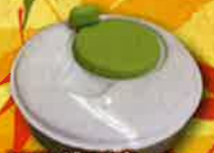
サラダスピナー 各日1名様