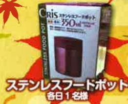
ステンレスフードポット 各日1名様