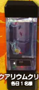
アクアリウムクリオネ 各日1名様