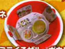
ミラくるザル・ボウル 各日1名様