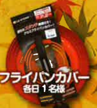
フライパンカバー 各日1名様